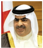
الشيخ فواز بن محمد.

صرح الشيخ فواز بن محمد آل خليفة سفير مملكة البحرين غير المقيم لدى مملكة هولندا بأن محكمة العدل الدولية أصدرت أمس حكماً بتقرير اختصاص منظمة الطيران المدني الدولي (إيكاو) بالنظر في الشكاوى التي تقدمت بها دولة قطر، اللتين تقدمت بهما دولة قطر، الأولى ضد مملكة البحرين والجزيرة العربية ودولة جمهورية مصر العربية ودولة الإمارات العربية المتحدة، والثانية ضد الدول الثلاث بالإضافة إلى المملكة العربية السعودية حول قرارات سيادية وإجراءات قانونية صححية، اتخذتها الدول الأربع في إطار مقاطعة قطر في يونيو ٢٠١٧م.