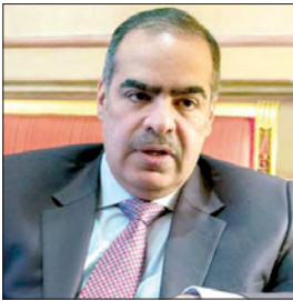
الشيخ فوزان بن محمد آل خليفة

تعتزم الدول العربية الأربع الداعية لمكافحة الإرهاب (مصر والسعودية والإمارات والبحرين) طرح القضية الخاصة بالزاعم القطرية بشأن إغلاق مجالاتها الجوية أمام الطائرات القطرية، أمام منظمة الطيران المدني «إيكاو» بعد قرار محكمة العدل الدولية. وأكد الشيخ فوزان بن محمد آل خليفة، سفير مملكة البحرين غير المقيم لدى مملكة هولندا، أن محكمة العدل الدولية، أصدرت أسس حكمين بتقرير اختصاص منظمة الطيران المدني الدولي (إيكاو) النظر في الشكاوي التي تقدمت بهما دولة قطر، الأولى ضد مملكة البحرين وجمهورية مصر العربية ودولة الإمارات العربية المتحدة، والثانية ضد الدول الثلاث بالإضافة إلى المملكة العربية