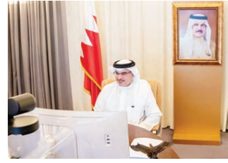
ترأس صاحب السمو الملكي الأمير سلمان بن حمد آل خليفة ولي العهد نائب القائد الأعلى النائب الأول لرئيس مجلس الوزراء اجتماع اللجنة التنسيقية ٣٣٣، والذي عقد أمس بن بعد.

ترأس صاحب السمو الملكي الأمير سلمان بن حمد آل خليفة ولي العهد نائب القائد الأعلى النائب الأول لرئيس مجلس الوزراء اجتماع اللجنة التنسيقية ٣٣٣، والذي عقد أمس بن بعد. وتناقشت اللجنة التنسيقية آخر مستجدات مشاريع الطاقة المتجددة والموسوعات المنصلة بقطاع الكهرباء والماء، كما طلعت على عرض بشأن