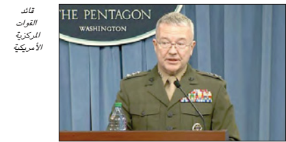
قائد القوات المركزية الأمريكية