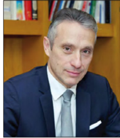
سفير الجمهورية الفرنسية

وأكد سفير الجمهورية الفرنسية لدى مملكة البحرين جيروم كوشارد أن مملكة البحرين وجمهورية فرنسا ماضيتان في تعزيز التعاون في مجالات الأعمال والتعليم والثقافة والرياضة. وأشار إلى أن المحادثة الهاتفية التي جرت قبل أيام قليلة بين حضرة صاحب الجلالة الملك حمد بن عيسى آل خليفة، والرئيس الفرنسي إيمانويل ماكرون، كانت فرصة أخرى لتعزيز الروابط بين البحرين وفرنسا، وتطوير العمل المشترك. جاء ذلك في احتفالية السفارة بمناسبة اليوم الوطني الفرنسي (يوم الباستيل)، إذ بعث السفير الفرنسي برسالة إلى الجالية الفرنسية وإلى أصدقاء فرنسا البحرينيين. وقال: «هذا العام، لا يمكن إلا أن يصادف عقد الاحتفال السنوي باليوم الوطني الفرنسي (14 يوليو)، المسمى أيضاً (يوم الباستيل)