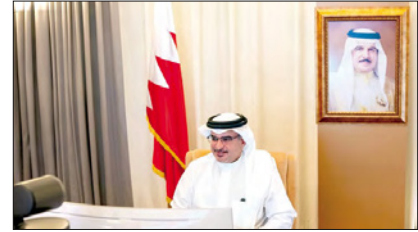
سعد ولي العهد ممرضاً اجتماع اللجنة التسييقية