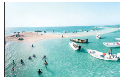
قطعة جرادة تستقبل عشاق البحر

رغم لهيب الصيف الحار.. غصت جزيرة «جرادة»، بعشاق البحر والرمال الذهبية والأجواء الهادئة وقضاء الأوقات الممتعة. ويعتبر «الغوص» للجدار المرجاني القريب من الجزيرة أحد أبرز الأنشطة التي يزاولها مرادو الجزيرة والتمتع بمشاهدة التنوع البيولوجي الكبير، إلى جانب السباحة في المياه الصافية، «الأيام» زارت الجزيرة التي أطلق عليها البعض «مالديف البحرين» برفقة «بحرين هولدينز»، ورصدت أجمل اللحظات التي يقضيها زوار الجزيرة.